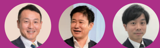
アクタス税理士法人 代表社員 税理士